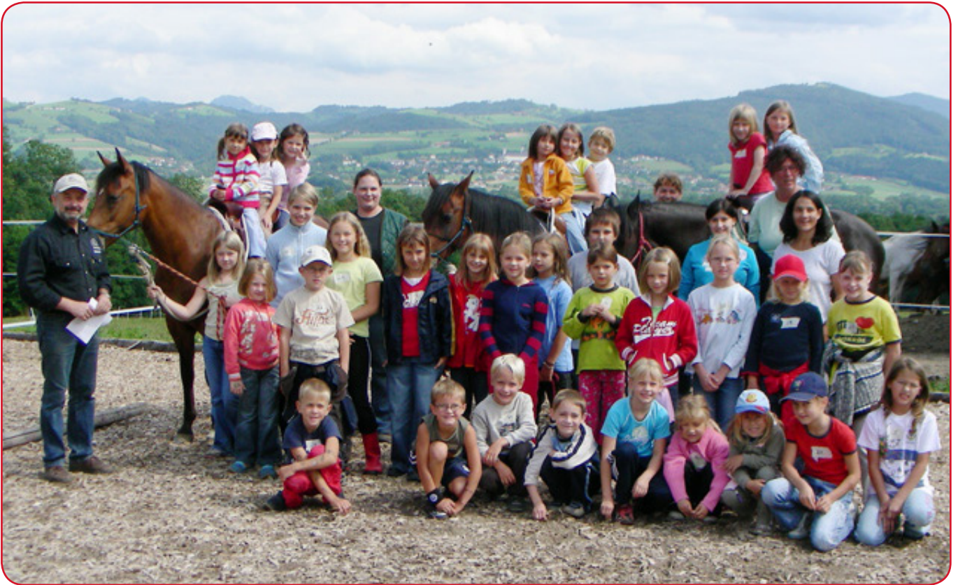
Ferienkalender 2014 - Pferdehof Auer