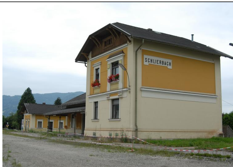
altes Bahnhofsgebäude mit Nebengebäuden (alle denkmalgeschützt)