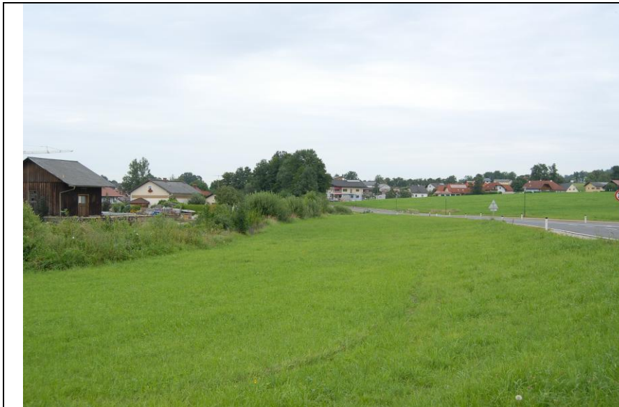
Grünstreifen zwischen Landstraße und altem Bahnhofsgelände

Durch die Notwendigkeit eines Neubaus des Gebäudes der freiwilligen Feuerwehr Schlierbach wurde seitens der Feuerwehr ein potentieller Standort in der Nähe der Schlierbacher Landstraße und in Zentrumsnähe gesucht. Als Favorit unter den möglichen Standorten wurde der südliche Teil des oben beschriebenen Grünstreifens (schräg gegenüber dem GH Thomaset) betrachtet.