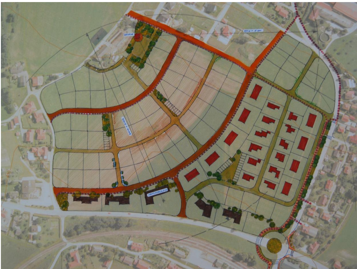
Abbildung 4: Skizzierung möglicher Widmung der Hofwiese durch Vierthaler Bernhard

Ein Projekt im Rahmen der Lokalen Agenda 21 Schlierbach