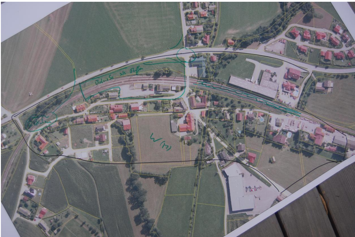
Abbildung 2: Skizzierung möglicher Widmung des alten Bahnhofgeländes durch die Arbeitsgruppe