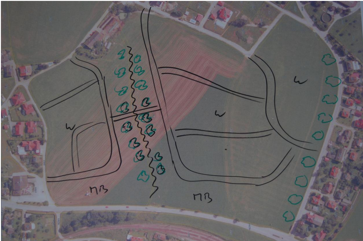
Abbildung 3: Skizzierung möglicher Widmung der Hofwiese durch die Arbeitsgruppe