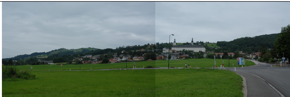
Hofwiesengelände mit Blick Richtung Osten zum Stift und Kreuzung beim GH Thomaset

Grundsätzlich stellt die Hofwiese ein sehr großes Areal im Zentrum von Schlierbach dar. Als quasi „Schaufenster“ sollten Veränderungen in diesem Areal auf diesen Aspekt hin bedacht werden. Der bisherige Bebauungsplan sieht eine raster- bis fächerförmige Bebauung vor und wurde in Teilen in den letzten Jahren entsprechend umgesetzt.